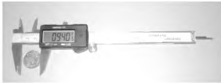
Рис. 2. Варіант цифрового вимірювання лінійних розмірів тіл

Модель індуктивного датчика доцільно зібрати і продемонструвати в процесі з'ясування умов залежності сили струму в колі за умови зміни його індуктивності. Індуктивність можна змінювати, наприклад, переміщуючи осердя в котушці індуктивності. Звертають увагу на чутливість такої установки, наводять приклади використання, зокрема і у датчиках малих лінійних переміщень. Така інформація може бути закладена в зміст експериментального завдання щодо вивчення роботи індуктивного датчика, для чого легко можна зібрати модуль на зразок зображеного на рис. 3, яким доцільно обладнати установку для визначення довжини світлової хвилі, де за показаннями датчика з належною точністю вимірюють відстані між дифракційними максимумами.