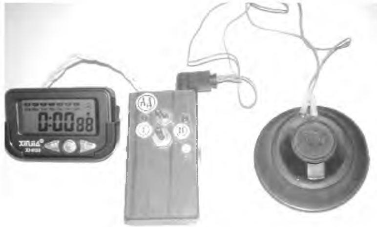
Рис. 1. Загальний вигляд експериментального модуля: секундомір, мікровимикач, акустичний датчик

Перше безпосереднє спілкування учнів з комплектом фотодатчика і секундоміра здійснюється в установці для визначення прискорення вільного падіння. Необхідність забезпечення належної точності вимірювань досить малих проміжків часу, де вагомими є соті долі секунди, уможлиблюється за рахунок використання саме фотодатчика. Виконання такого завдання у пропонованому нами варіанті реалізуються у лабораторній роботі або як варіант експериментальної задачі (№ 4.155) [3, с. 115]. Такий підхід дозволяє зекономити час на постановку робіт практикуму, охопивши змістом однієї роботи завдання кількох робіт, наприклад робіт 3-8, 12-14, що передбачені навчальними програмами [6].