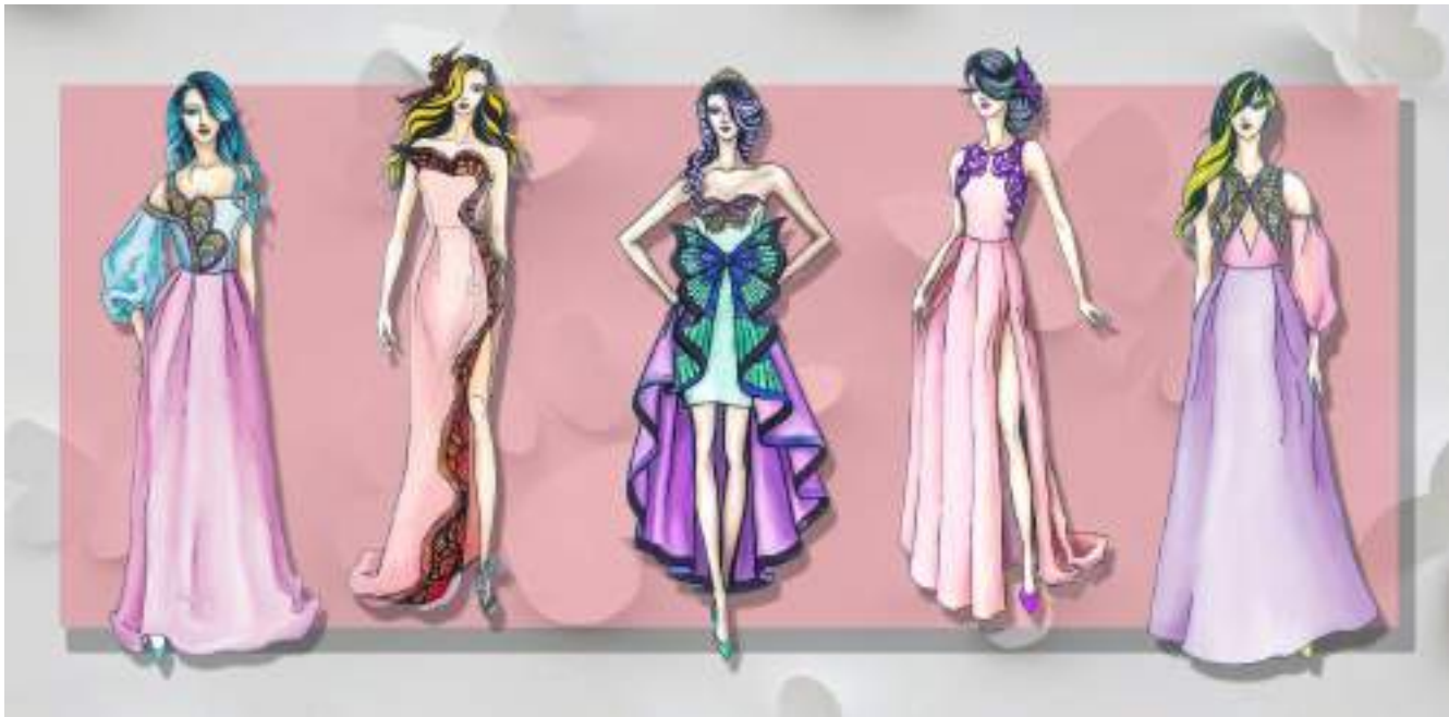
Рис. 4. Ескізи колекції урочистих суконь « Butterfly story » створені на основі творчого джерела «метелики»

абстрактно; в ескізах, створених за асоціаціями, має простежуватися зв'язок з першоджерелом [7, с. 59-60]. Розроблена в результаті дослідження авторська колекція суконь для випускного балу « Butterfly story » (рис. 4) є перспективною, на її основі можуть бути створені нові моделі із застосуванням нестандартних авторських і дизайнерських рішень.