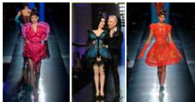
Рис. 3 – Творче джерело «метелики» у колекції дизайнера Жан-Поль Готьє

Вишукані сукні із метеликами можна побачити в творчості українських дизайнерів. Наприклад, в інтернет-магазині [11] представлено ексклюзивні моделі з колекцій українського весільного бренду Crystal Design.