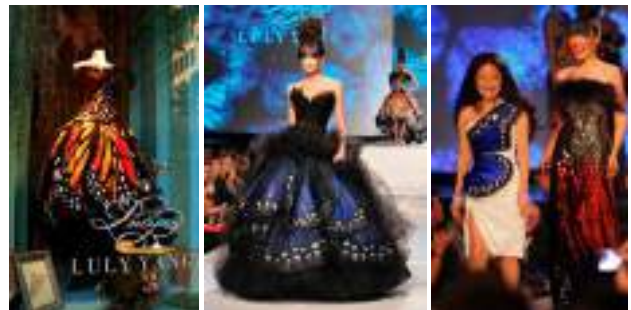
Рис. 2. Творче джерело «метелики» у колекції дизайнера Лулі Янг

Творче джерело «метелики» неодноразово надихали відомих дизайнерів для створення колекції одягу, зокрема Лулі Янг (Рис. 2.), Жан-Поль Готьє (Рис. 3.) та інших.