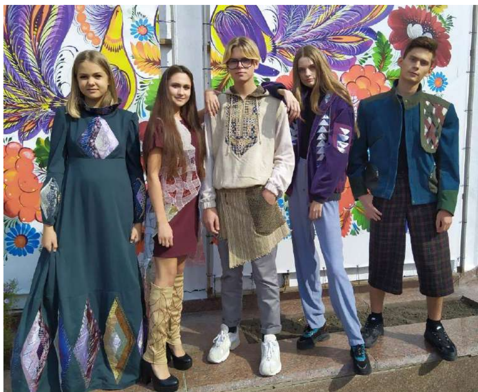
Рис. 6. Фрагмент колекції «Реінкарнація», дизайнер І. Кудревич

Висновки. Клаптикове шиття або печворк має давню історію і широко застосовується як вид декоративно-прикладного мистецтва для оздоблення та виготовлення одягу, аксесуарів, предметів інтер'єру. У результаті проведеного аналізу печворку було удосконалено класифікацію його різновидів, яка включає види, шви та блоки даної техніки. Наведено способи