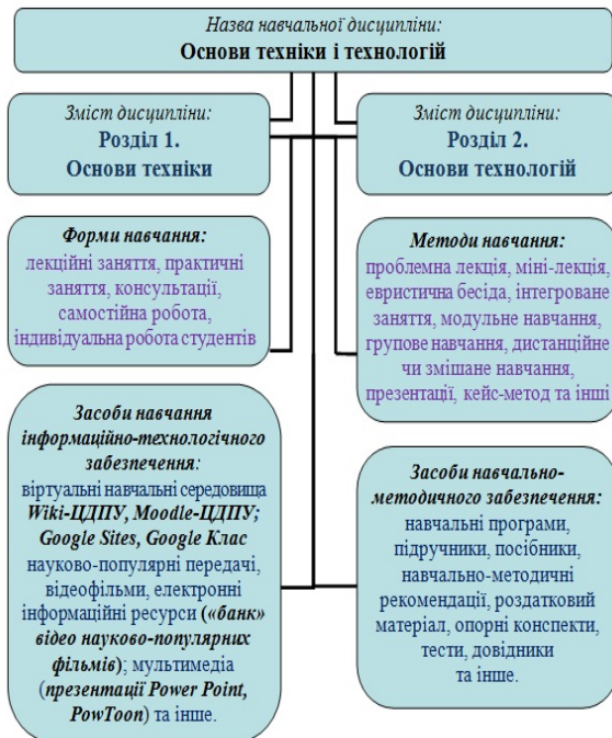
Рис. 1. Дидактичний інформаційно-технологічний комплекс до навчально-методичного забезпечення вивчення курсу «Основи техніки та технологій»

Навчальний контент інформаційно-технологічного забезпечення обирається з урахуванням специфіки підготовки фахівця, кадрового потенціалу та можливостей матеріально-технічної бази навчального закладу. До навчального контенту забезпечення фахової підготовки майбутніх вчителів праці можна віднести: дидактичні комплекси інформаційного забезпечення; електронні навчально-методичні видання; електронні ресурси довідково-інформаційного характеру; мережеві електронні ресурси; типовий комплект засобів інформаційної підтримки; смарткейси; електронні інтерактивні освітні ресурси; навчальні середовища для самостійного конструювання електронних навчальних ресурсів; навчально-технологічні програмні засоби; імітаційні середовища; системи автоматизованого проектування; навчально-ігрові програмні засоби; педагогічні програмні засоби навчальних дисциплін; демонстраційні електронні ресурси; автоматизовану систему оцінки і контролю знань студентів [2; 4; 5].