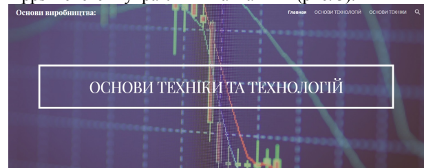
Рис. 2. Скриншот сторінки створеного сайту в Google Sites «Основи техніки та технологій»

Зважаючи на високу популярність серед українських користувачів та широкі можливості Google, пропонуємо скористатися даним сервісом при організації навчального процесу ЗВО. На базі доступних програмних продуктів Google можна створити конкретні електронні навчальні курси. Наприклад, нами було розроблено навчальний сайт Google Sites New (рис. 2) та створено вільний інтерактивний простір у системі «викладач – комп'ютер – студент» розроблений на базі Google Apps – системі управління навчанням (рис. 3).