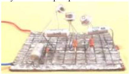
Рис. 2. Зовнішній вид макетної плати звукового генератора

радіодеталі з не укороченими выводами. На рис. 2. представлено зовнішній вид макетної плати для створення звукового генератора.