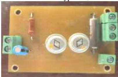
Рис. 3. Зовнішній вид друкованої плати з радіодеталлями

При подальшому виготовленні електронного пристрою, учні переходять до виготовлення монтажної плати. В літературі описано багато різних способів виготовлення друкованих плат, проте як показує досвід для початківців доцільніше використовувати добре відомою технологією вирізання різцем мідних доріжок на фольгованому склотекстоліті. На рис. 3 показано один з прикладів монтажу радіодеталей на друкованій платі, розробленій та виготовленій гуртківцями.