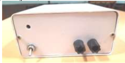
Рис. 5. Зовнішній вигляд пристрою

добрий естетичний вигляд, зручний та надійний в користуванні(рис. 5).