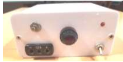
Рис. 1. Зовнішній вигляд джерела живлення

Робота гуртка з радіотехнічного конструювання базується на сам перед на використанні міністерської програми [3]. Проте, при її реалізації виникає ряд проблем, які потребують від вчителя більш детального осмислення своєї діяльності. Так, наприклад, виготовлення детекторного приймача стає недоцільним у зв'язку з відсутністю роботи радіостанцій СХ та ДХ діапазону. Якщо гурток тільки розпочинає свою роботу, то перед ним виникають певні труднощі з матеріального та технічного забезпечення. Потрібні різні джерела живлення, генератори, вимірювачі R,C,L та інше. Тому доцільно залучати більш досвідчених учнів до їх виготовлення. Це сприятиме створенню належної матеріально-технічної бази гуртка, та вивчення ними принципу роботи розроблених радіоелектронних пристроїв. На рис. 1. представлено виготовлений гуртківцями блок живлення з регульованою напругою 0 – 12В.