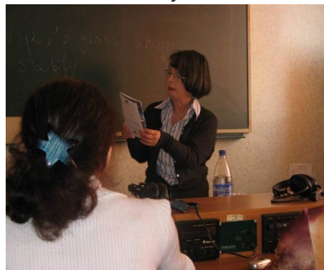
Майстер-клас для професорсько-викладацького складу факультету іноземних мов КДПУ (Кіровоград, квітень 2007)