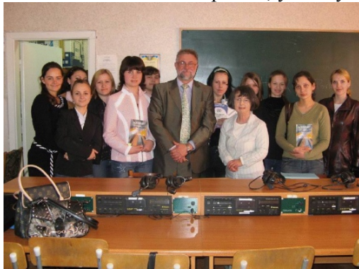
Проф. Снелл-Горнбі з деканом та студентами магістратури факультету іноземних мов КДПУ (Кіровоград, квітень 2007)

Після одного з семінарів у Відні професор Мері Снелл-Горнбі (до речі, професор Снелл-Горнбі за фінансової підтримки Фонду Österreich-Kooperation з 16-го по 23-тє квітня 2007 року читала лекції та семінари німецькою та англійською мовами на тему « Текст і переклад » для студентів та проводила майстер-класи для професорсько-викладацького складу на факультеті іноземних мов Кіровоградського державного педагогічного університету імені Володимира Винниченка) запросила українських представників відвідати її теоретичне заняття для аспірантів, у якому вони з задоволенням взяли участь.