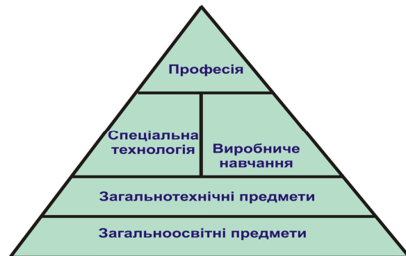
Рис.1. Піраміда навчального процесу

описана в науковій праці автора [6]. Розробка даної піраміди дозволила нам сконцентрувати увагу на конкретній профільній дисципліні, яка пов'язана з загальноосвітніми та провідними загальнотехнічними дисциплінами міжпредметними зв'язками.