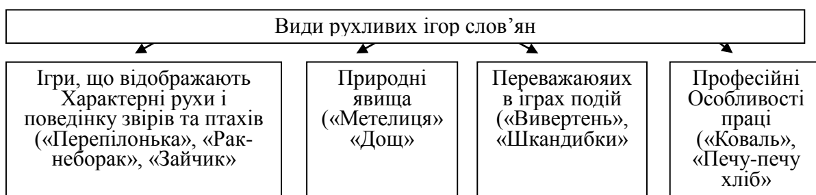
Рисунок 2. Види рухливих ігор слов'ян.

Дідух та о. Білан) у розділі «Рідний край», а також у Концепції дошкільного виховання в Україні у змісті і засобах національного виховання [1, с. 99].