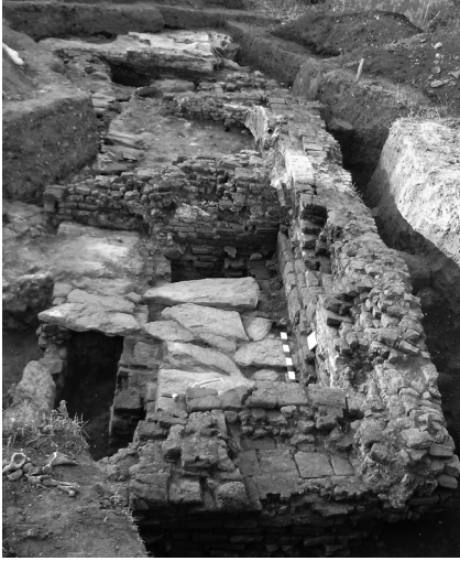
Ілюстр.3 Лазня гамам

ділянках поселення, що свідчить про розгалужену систему водопостачання. Лінія водогону споруджувалася з окремих секцій керамічних труб завдовжки 0,5–1 м, скріплених вапняковим розчином (див. ілюстр.2). Такі глиняні труби на території України й Молдавії для цього часу відомі лише на золотоординських пам'ятках – Кучугурське городище біля Запоріжжя 75 , Старий Оргіїв 76 , Костешти 77 .