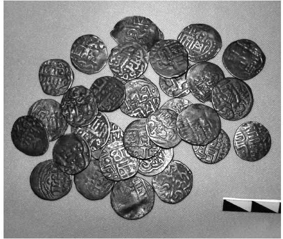
Ілюстр.5 Срібні диргеми з Торговиці

За археологічними матеріалами час функціонування древнього міста можна визначити першою половиною – серединою XIV ст. Більш точні хронологічні репери спробуємо встановити за виявленими монетами, адже торговицький комплекс представлено досить репрезентативною колекцією, до складу якої входить 36 срібних диргемів і 64 мідних пули 83 (див. ілюстр.5). Їх знахідки відомі в похованнях могильника та на об'єктах цивільної забудови. Крім того, ще в 1894 р. на березі Синюхи було відкрито знаменитий Торговицький скарб, який складався зі 173 монет 84 .