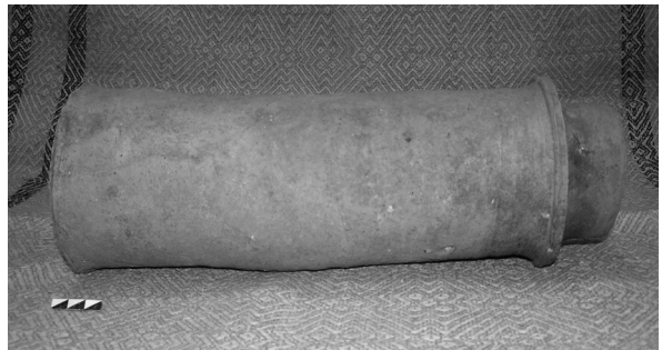
Ілюстр.2 Секція керамічного водогону