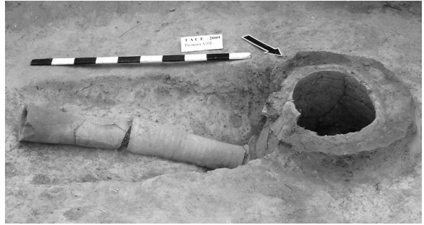
Ілюстр.1 Залишки глиняних тандирів у Торговиці

Таким же привнесеним елементом у системі функціонування населеного пункту на Синюсі був водогін, залишки якого зафіксовано на різних, досить віддалених,