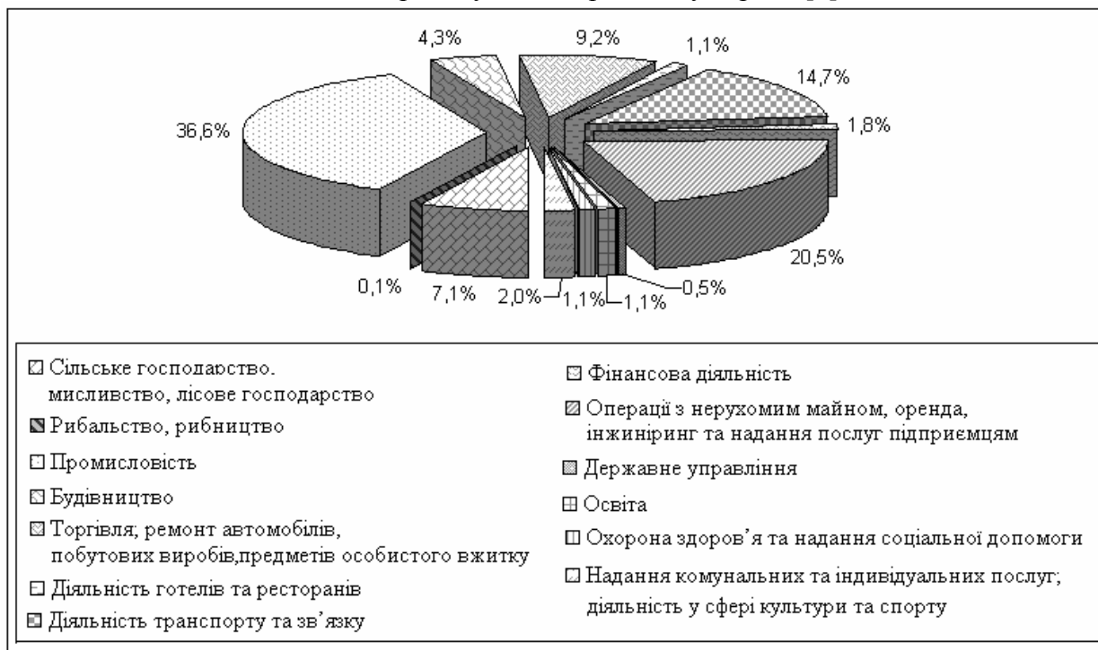
Рис. 2. Частка у загальному обсязі прямих іноземних інвестицій станом на 1.10.2008 року у % (складено авторами за даними [8])

нозу та 15,8 % від загального експорту України. Процеси євроінтеграції, з одного боку, позитивно відбиваються на збільшенні обсягів інвестицій з країн-членів Європейського Союзу, з іншого – формують передумови зростання імпортої залежності країни, що може мати негативні наслідки для економіки України у довгостроковому періоді [2].