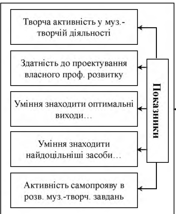
Рис. 1. Структура професійної мобільності майбутнього педагога-музиканта.